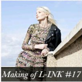
Making of L-INK #17