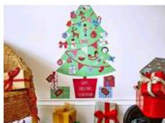
Foto : vía Especial Navidad...Decorando con Vinilos Holaaaaa familia ¿cómo ha ido este Finde largooooo de tres días? ¡seguro que fenomenal! Leer el resto

El 09 diciembre 2014 por Anakonda61 DECORACIÓN. TENDENCIAS